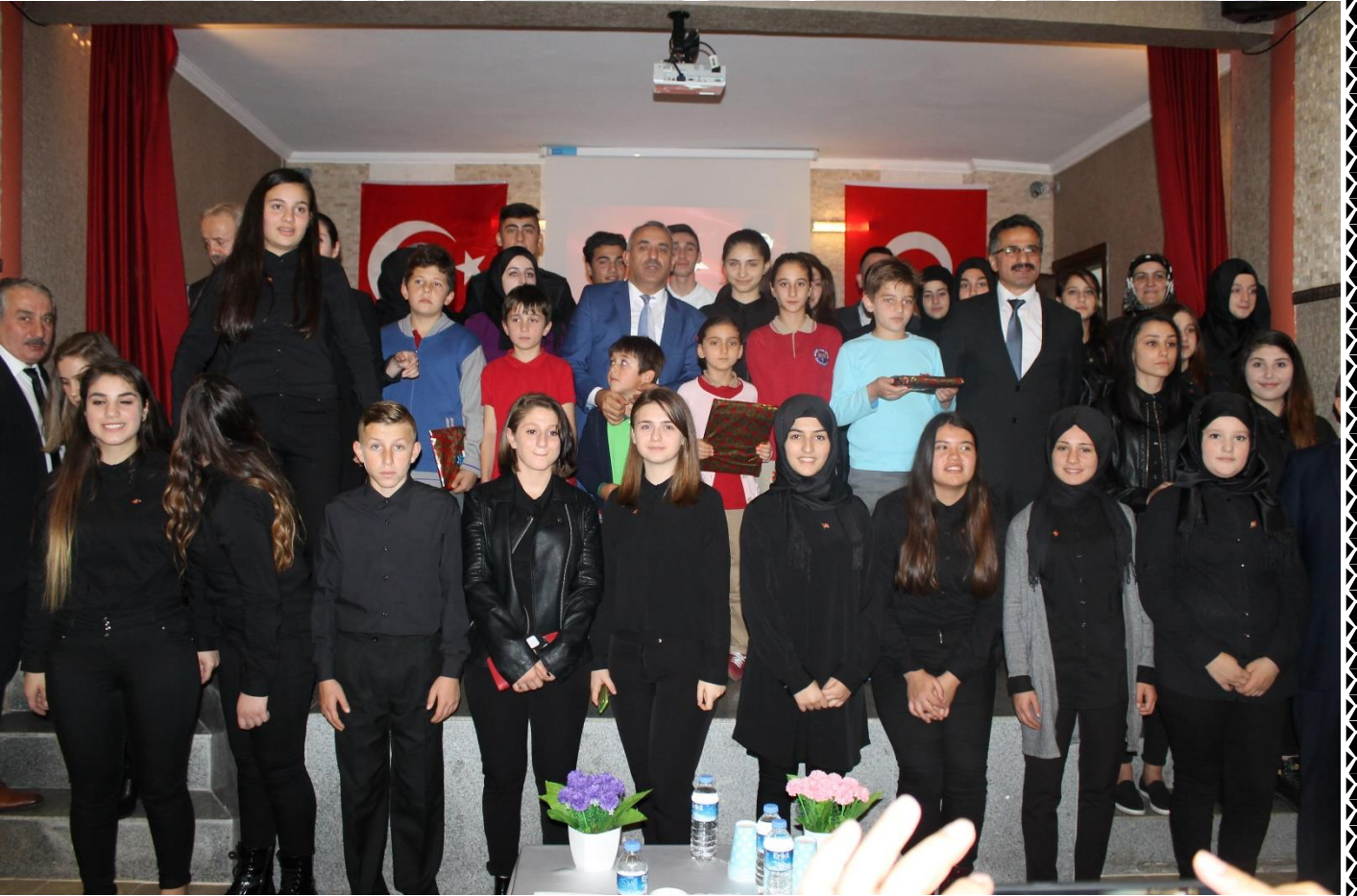
2014-2015 İLK ŞİRKETİM