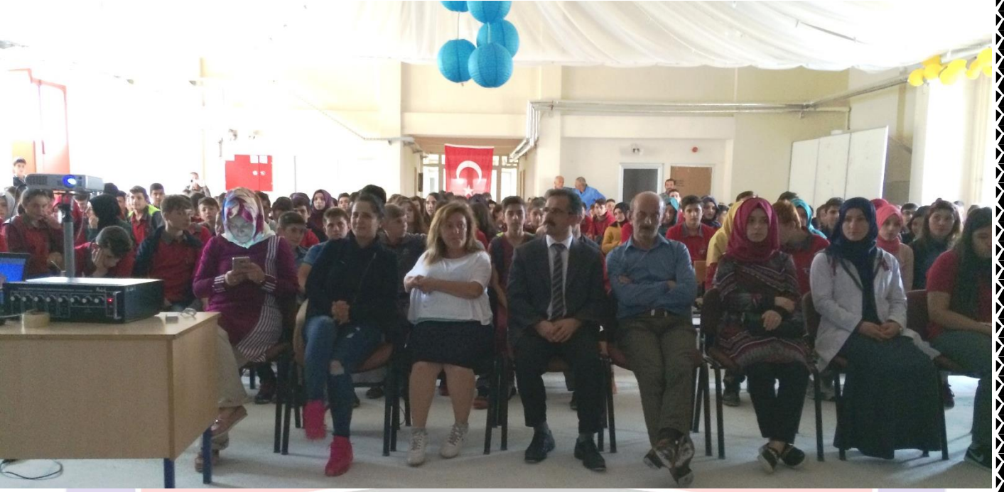
10 KASIM ATATÜRK'Ü ANMA PROGRAMI